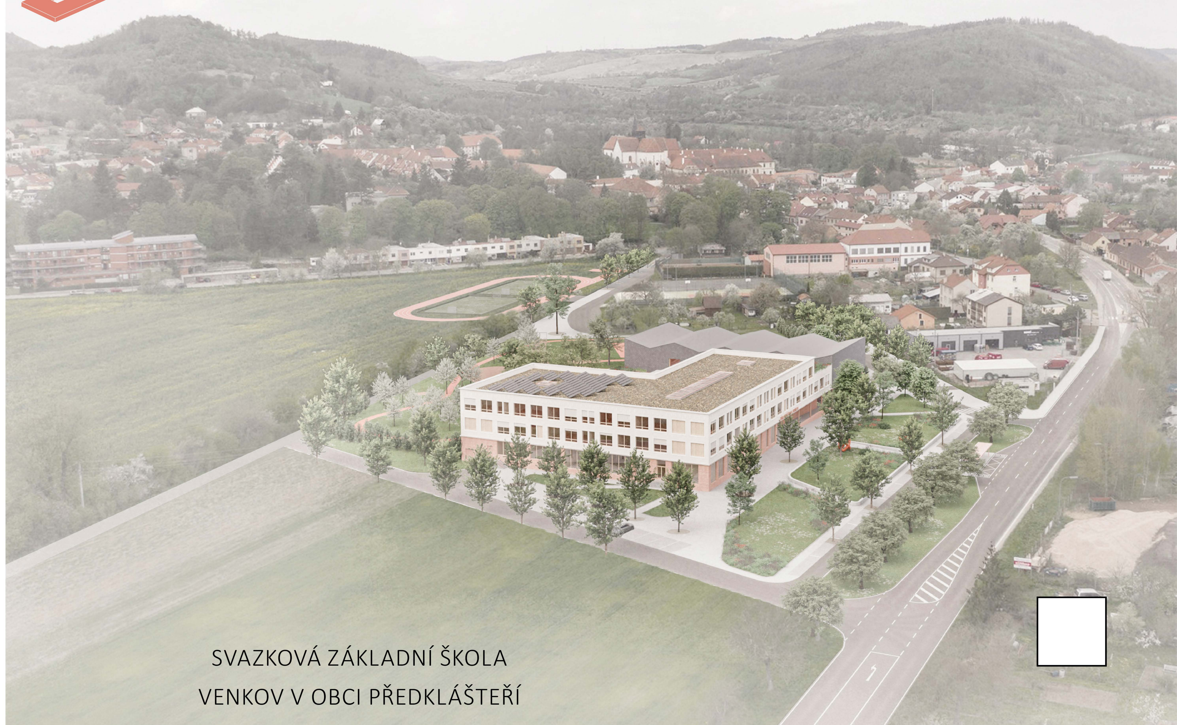
SVAZKOVÁ ZÁKLADNÍ ŠKOLA VENKOV V OBCI PŘEDKLÁŠTEŘÍ