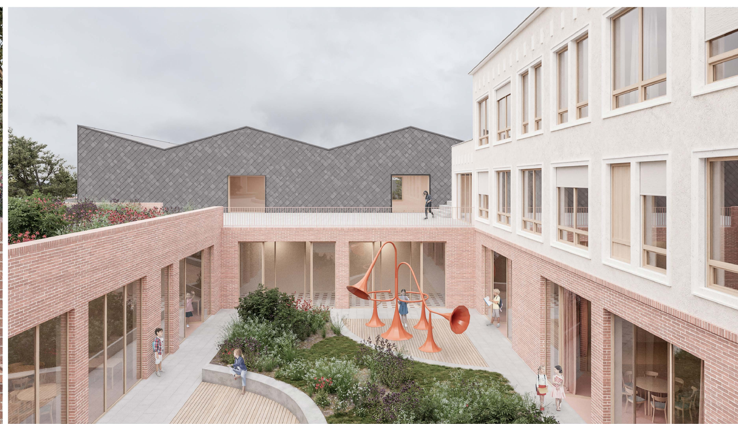
pohled do atria, na terasu a tělocvičnu v zadní části