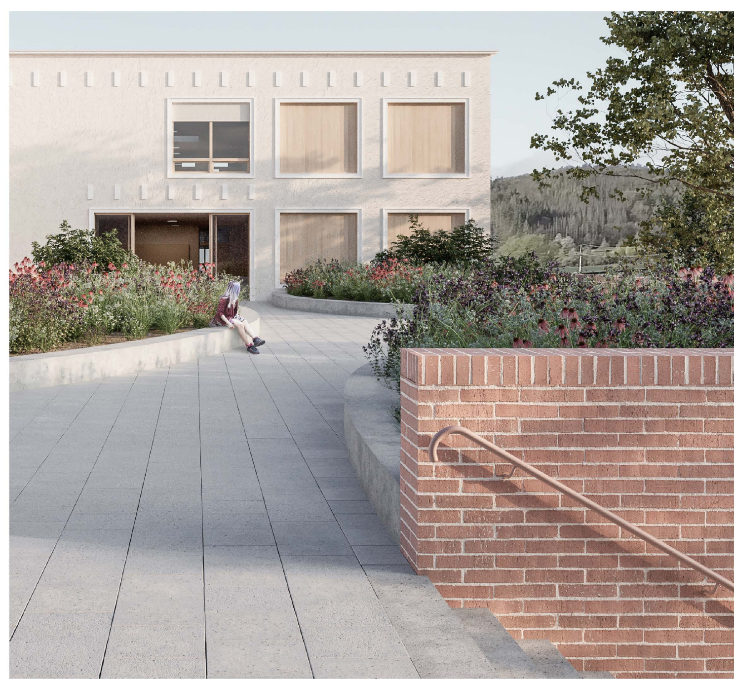
detail schodiště do zahrady